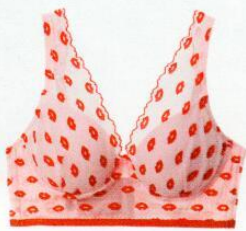
Reggiseno push-up (16,99 euro) e slip stampati (6,99 euro) TEZENIS.

Un guardaroba completo (abiti, borse, scarpe, occhiali...), oggetti romantici e gli immancabili cioccolatini. Per chi festeggia il 14 febbraio