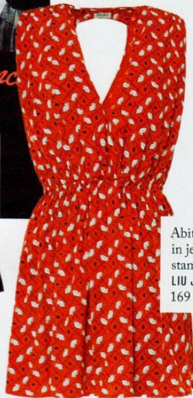
Abito in jersey stampato LIU JO 169 euro.