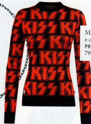
Maglia in lurex e cotone PHILIPP PLEIN 798 euro.