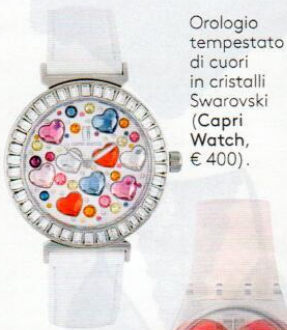
Orologio tempestato di cuori in cristalli Swarovski (Capri Watch, € 400).

Da sinistra: collana con pendente perlage di argento (Giovanni Raspini, € 190); pendente in golden rosé e pietra sfaccettata (Bronzallure, € 139); bracciale con ciondoli con cristalli Swarovski (Guess Jewellery, € 49); bracciale in ottone rosato con cristalli (Stroili, € 24,90); bracciale Sapiencia in argento con grani e topazio (Tuum, € 119).