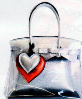
Da sinistra: borsa Love effetto pelle (Braccialini Tua, € 314); mini borsa a un manico in pelle (Coccinelle, € 330); Miss Plus Agua con pochette rimovibile e ciondoli a cuore (Save my Bag, 173).