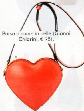
Borsa a cuore in pelle (Gianni Chiarini, € 98).