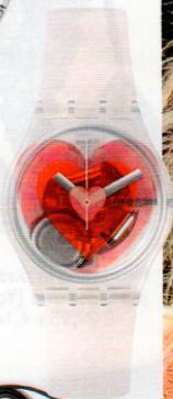
Triple Love con maxi cuore sul quadrante (Swatch, € 70).