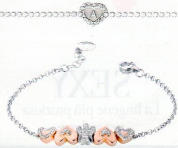
Bracciale in argento bianco e rosato (Roberto Giannotti, € 110).