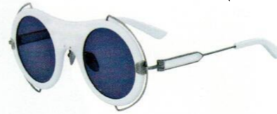
Calvin Klein 205W39NYC