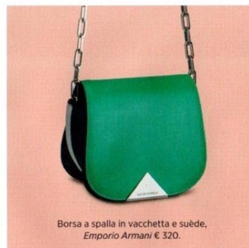
Borsa a spalla in vacchetta e suède, Emporio Armani € 320.