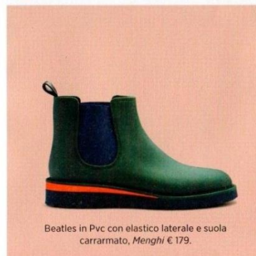
Beatles in Pvc con elastico laterale e suola carrarmato, Menghi € 179.