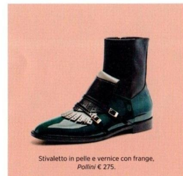
Stivaletto in pelle e vernice con frange, Pollini € 275.