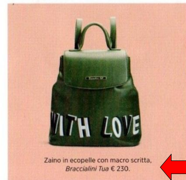
Zaino in ecopelle con macro scritta, Braccialini Tua € 230.