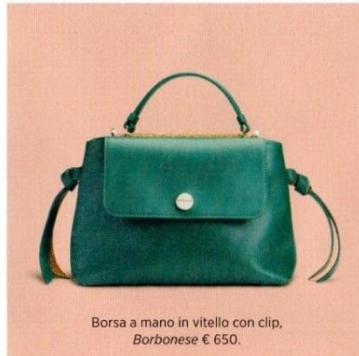
Borsa a mano in vitello con clip, Borbonese € 650.

DAL VERDE QUERCIA ALLE SFUMATURE DEL MUSCHIO, L'AUTUNNO È GREEN