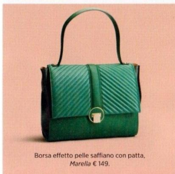
Borsa effetto pelle saffiano con patta, Marella € 149.