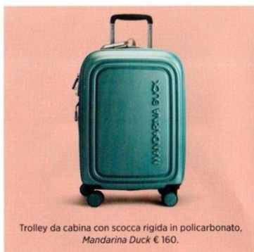
Trolley da cabina con scocca rigida in policarbonato, Mandarina Duck € 160.